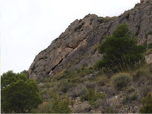
Foto 3) Vista lateral de la falla que forma la sima o grieta tectónica.