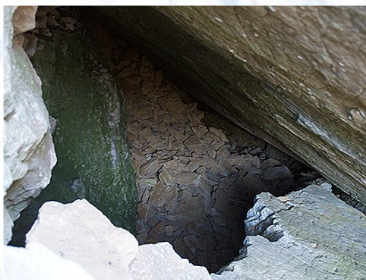
Foto 2) Fondo de la primera sala con una cascada de piedra hacia lo que se supone la continuación de la sima.