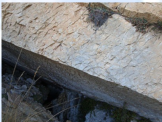
Foto 1) Estrato arenisco con deslizamiento tectónico. Boca de la sima.

En principio la cavidad se abre en un espejo de falla formado por el deslizamiento de un estrato, presentando un techo liso y consistente. Su boca inclinada mide unos 2 m. de larga por no más de 80 cts. de alta (Foto 1 y 2). Tras la entrada se abre una estancia muy irregular donde las rocas y piedras sueltas dan un aspecto caótico, observándose hacia el fondo la posibilidad de progresión en vertical. (Foto 3)