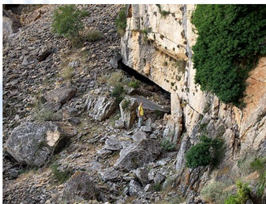
Foto 3) Vista de la localización de la sima de l' Espill en la aproximación a la misma.

http://deco.alc.upv.es/cuevasalicante/pdf/Penyes-Roset-CKE-579.pdf