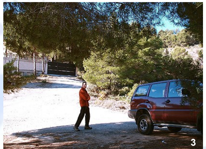
Foto 1) Boca de la cueva y tramo excavado Foto 2) Distancia entre la cueva y la sima Foto 3) Vista del aparcamiento