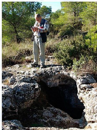
Foto 1) Boca de la sima situada en la senda de acceso a la Campana