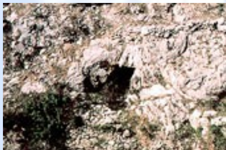
Foto 1) Foto zoom desde el camino hecha en 1993, antes de ser utilizada para la sismografía.