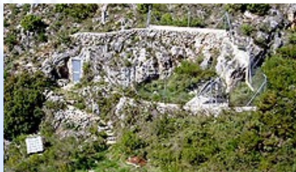
Foto 2) Foto hecha en Mayo del 2006, tras la adaptación sismográfica.