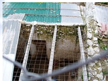
Foto 2) Corral donde se encuentra la cueva, tras la puerta observada.