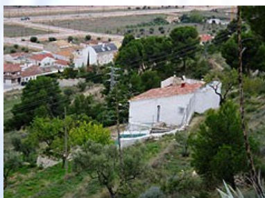
Foto 1) Casa por donde pasa la senda de acceso a la ermita. Al lado el corral donde se ubica la cueva.

Desde el pie del montículo que culmina con la ermita de San Miguel, y subiendo por el antiguo acceso, actualmente ensanchado en su primera parte y a no más de 150 m. se encuentra una casa (Foto 1) por la que discurre la senda. En esta misma casa y dentro del corral (Foto 2) se encuentra la cavidad.